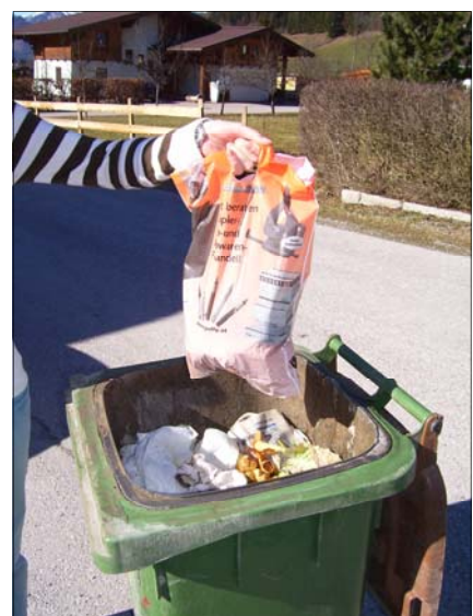
So bitte nicht! (Bild u. Text. AWV Pongau)

Plastik verpackte Lebensmittel bitte auspacken !!! Nicht abgelaufene Ware bitte vorher essen. Das Eintreten des Ablaufdatums = Mindesthaltbarkeitsdatum muss nicht zugleich bedeuten, dass das Lebensmittel schon verdorben ist, probieren Sie erst einmal. Zur Sammlung von Bioabfällen geeignet sind Zeitungen, Papiersäcke oder Maisstärkesäcke.