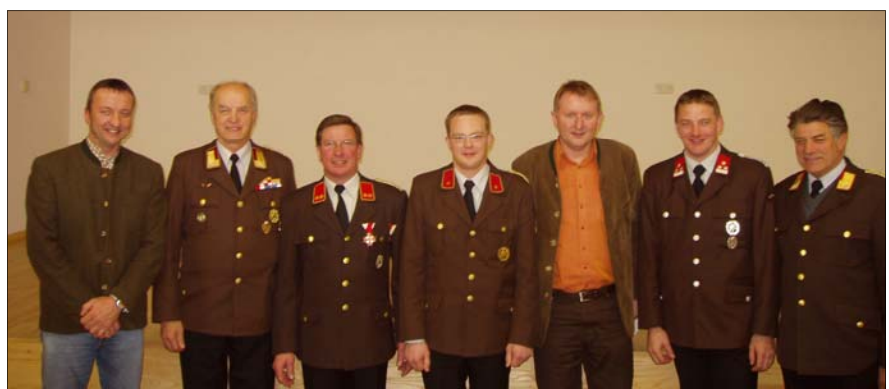
Jahreshauptversammlung am 26.01.2007