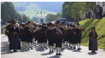
Text und Foto: Josef Brandauer jun.

Als Gestalter dieser Homepage würde ich mich sehr über einige Rückmeldungen freuen, über das, was gut ist und natürlich auch das, was noch verbesserungswürdig ist. Meine E-Mail Adresse finden Sie unter Kontakt – Webmaster. In diesem Sinne werden wir mit neuem Schwung ins Jahr 2007 starten und freuen uns auf ein Wiedersehen.