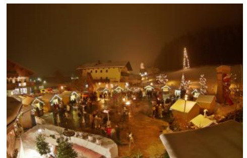
- Vorweihnachtliche Stimmung beim ersten Werfenwenger Dorfadvent -

Abschließend ein Dankeschön an die Werfenwenger Wirte, die mit dem ersten Werfenwenger Dorfadvent eine gelungene Veranstaltung ins Leben gerufen haben, die von der Bevölkerung sehr gut angenommen wurde.