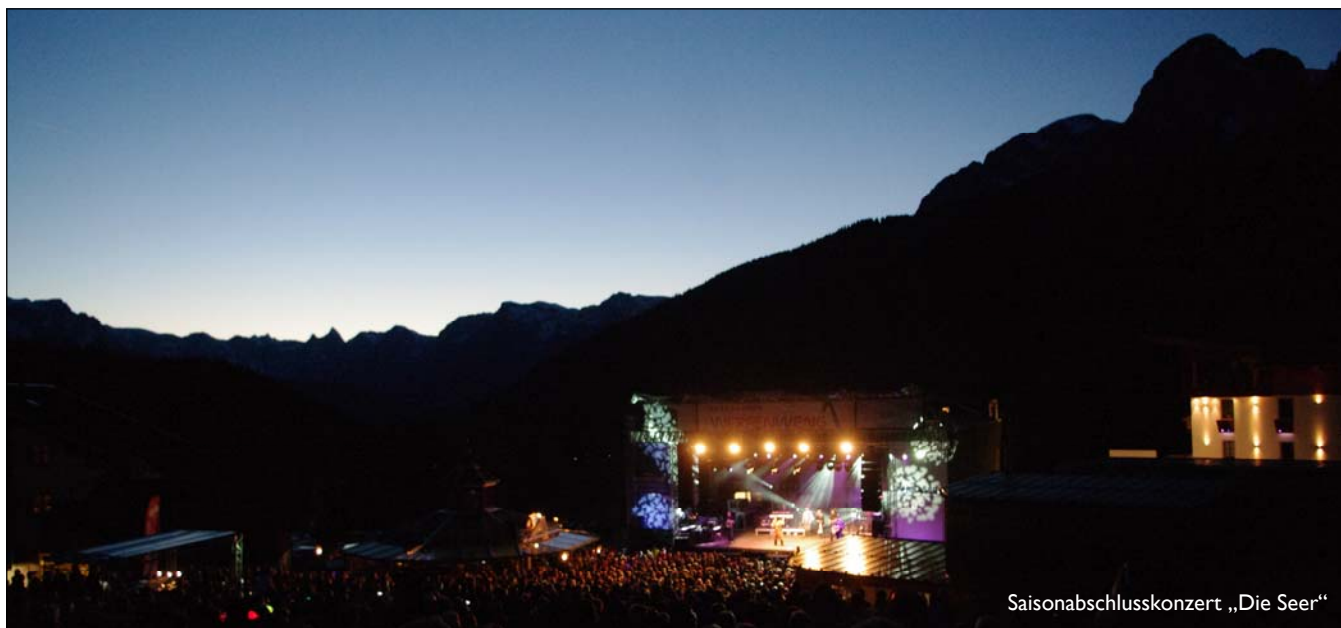
Saisonabschlusskonzert „Die Seer“